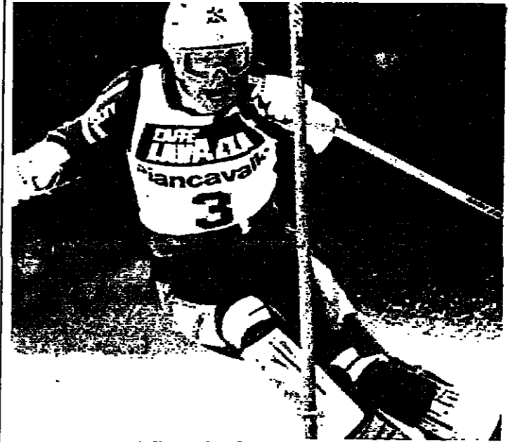
السويسرية فريد شاذلي في طريقها للفوز بسباق التخرج